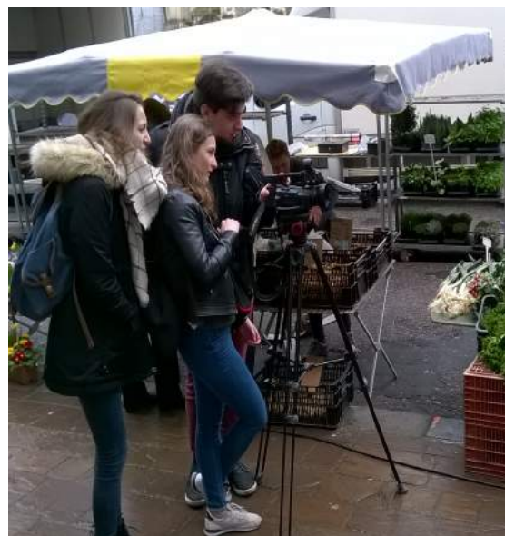
Les trois élèves de seconde lors du tournage de leur reportage, lauréats 2015 du Prix Un jour Un média