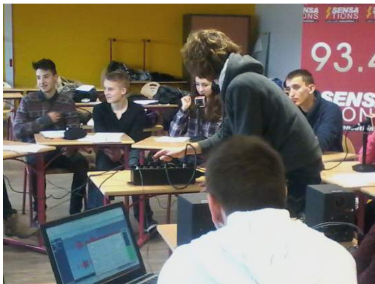
Des étudiants de BTS CIM, attirés par la technique et finalement acteurs d'une émission radio