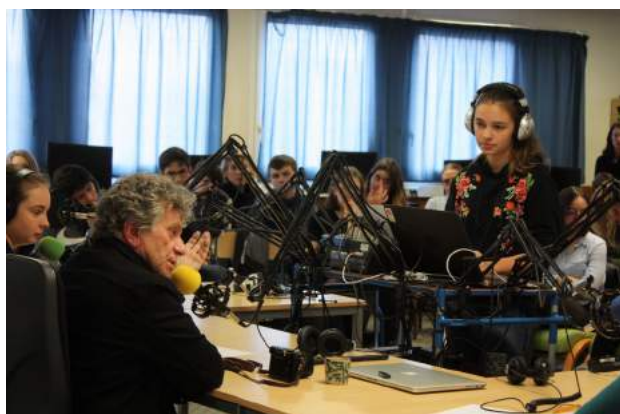
Le photo-journaliste Patrick Chauvel rencontre les élèves du lycée

En 2018, l'Atelier médias a organisé une rencontre entre 110 lycéens et le photo-journaliste indépendant Patrick Chauvel . Cette rencontre organisée par les élèves sous forme de table ronde a été enregistrée par les élèves. En parallèle, les élèves ont présenté les travaux réalisés en prolongement du Prix Bayeux 2018 sous forme d'exposition dans le lycée. Une antenne Amnesty International a été montée, et les pétitions pour la défense des droits humains ont recueilli plus de 300 signatures.